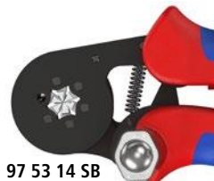
97 53 14 SB