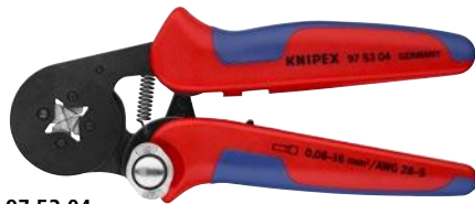
97 53 04