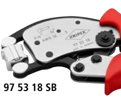
97 53 18 SB