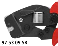
97 53 09 SB