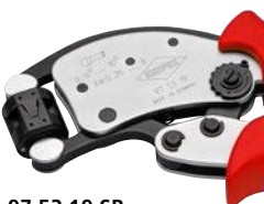
97 53 19 SB