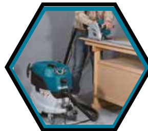
Automatische Aktivierung des Staubsaugers beim Start des angeschlossenen Werkzeugs.