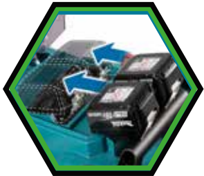
Die Akkus werden parallel in separaten Akku-Dockingstationen platziert.