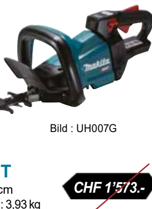
Bild : UH007G