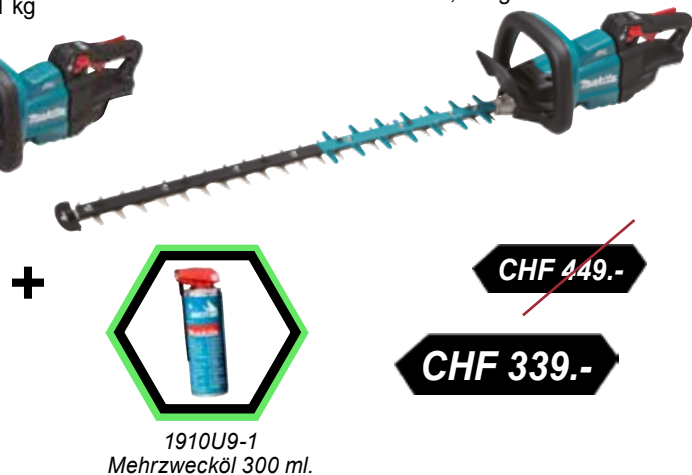
1910U9-1 Mehrzwecköl 300 ml.

Schnittlänge : 75 cm Gewicht ohne Akku : 3,79 kg