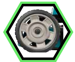
Grosse Räder, um dem Benutzer auf schlammigem oder holprigem Gelände zu helfen.