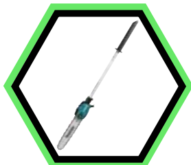
191T38-7 - Hochentaster- Aufsatz EY403MP.

Stufenlose Geschwindigkeit mit Schalter regulierbar.