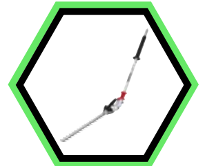
1912T8-8 - Heckenscheren- Aufsatz 500 mm mit Winkeleinstellung EN402MP.