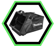
1913F7-8 Sammelkorb 47 L