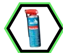
1910U9-1 Mehrzwecköl 300 ml.