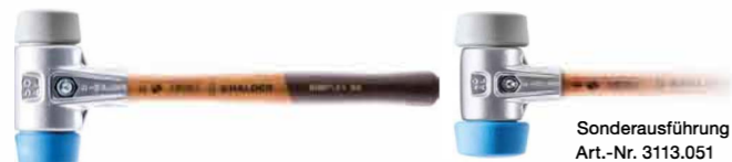
Sonderausführung Art.-Nr. 3113.051