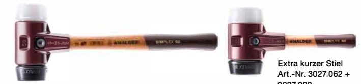
Extra kurzer Stiel Art.-Nr. 3027.062 + 3027.082