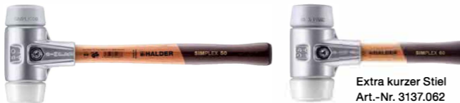
Extra kurzer Stiel Art.-Nr. 3137.062