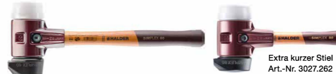
Extra kurzer Stiel Art.-Nr. 3027.262 + 3027.282