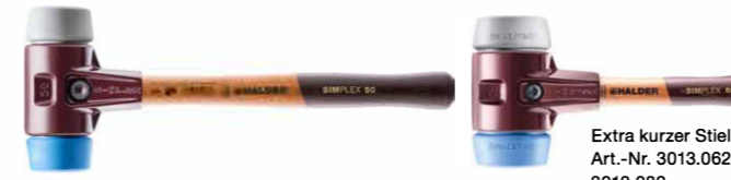
Extra kurzer Stiel Art.-Nr. 3013.062 + 3013.082