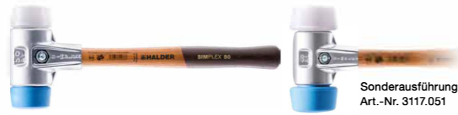
Sonderausführung Art.-Nr. 3117.051