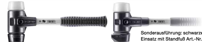
Sonderausführung: Einsatz mit Standfuß Art.-Nr. 3727.260 + 3727.280