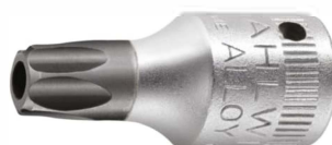
01351020 Schraubendrehereinsatz z