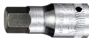
01120004 INHEX- Schraubendrehereinsatz z