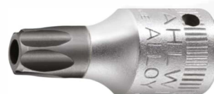
01351027 Schraubendrehereinsatz z