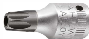
01351010 Schraubendrehereinsatz z