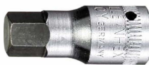
01120003 INHEX- Schraubendrehereinsatz z