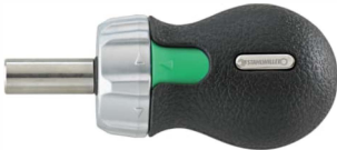
18120002 Bit- Ratschenschraubendre- her