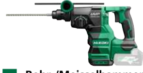
Bohr-/Meisselhammer DH3628DA SDS+ - 28 mm - 3,2 J 536.-