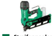
Streifennagler 20° NR1890DRA NK20 - 50-90 mm 839.-