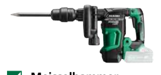
Meisselhammer H3641DA SDS Max - 6,8 J - 2.880/min 586.-