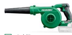
Gebläse RB18DC 3,5 m³/min. 124.-