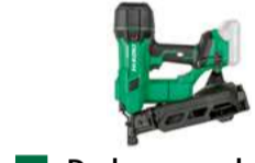
Dachpappnagler NV1845DA DN16 - 25-45 mm 874.-