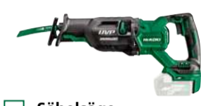
Säbelsäge CR36DA 32 mm - 3.000 /min. 474.-