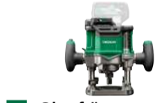
Oberfräse M3612DA 6, 8, 12 mm - 50 mm 561.-