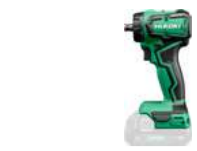
Bohrschrauber DS18DDQ 55 Nm - Quick 224.-