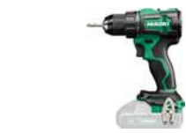
Bohrschrauber DS18DE 70/40 Nm 274.-