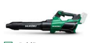
Gebläse RB36DC 19,8 m³/min. 431.-