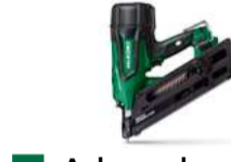
Ankernagler NR3665DA AK34 - 38-64 mm 749.-