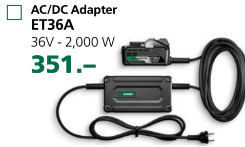
AC/DC Adapter ET36A 36V - 2,000 W 351.-