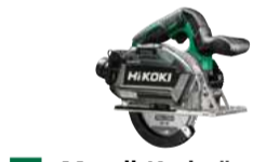
Metall-Kreissäge CD3605DB Ø150 mm - 57,5 mm 430.-