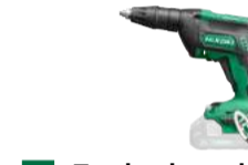
Trockenbauschrauber W18DA_OHNE 5.000/min 324.-