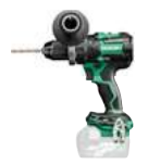
Schlagbohrschrauber DV36DC 155/100 Nm 436.-