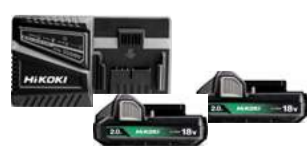
Booster BSL1820M 18V - 2,0 Ah 230.-