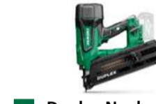
Duplex Nagler NR3675DD 21° - 57/45 - 89/77 mm 856.-