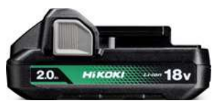
Akku BSL1820M 18V - 2,0 Ah 105.-