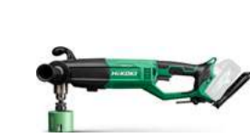
Winkelbohrmasch. D36DYA Max. 159 mm 574.-