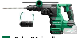
Bohr-/Meisselhammer DH3628DC SDS+ - 28 mm - 3,2 J 574.-