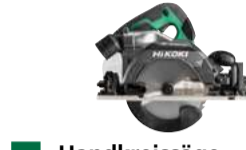
Handkreissäge C3606DUM Ø165 mm - 66 mm - GR 536.-