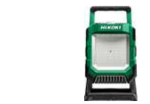
Baustellenstrahler UB18DC 4,000 Lumen 261.-