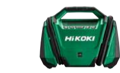
Kompressor UP18DA 11 bar - dual function 199.-