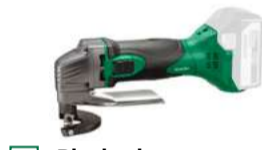
Blechscher CE18DSL Max. 2,3 mm 536.-