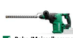
Bohr-/Meisselhammer DH3635DC SDS+ - 35 mm - 4,2 J 795.-