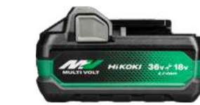
Akku Akku_A 36/18V - 2,5/5,0 Ah 199.-