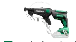
Trockenbauschrauber W18DA 5.000/min 436.-