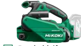
Bandschleifer SB3608DA 76 x 533 mm 461.-