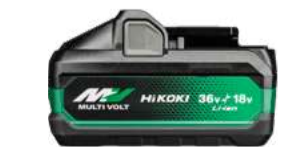
Akku Akku_B 36/18V - 4,0/8,0 Ah 248.-