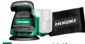
Exzentrerschleifer SV1813DA Ø125 mm 224.-