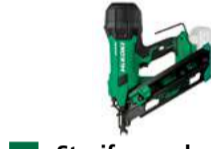
Streifennagler 34° NR1890DCA NP34 - 50-90 mm 839.-