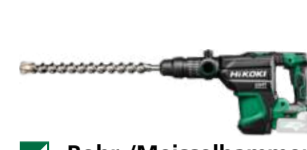
Bohr-/Meisselhammer DH3640DA SDS Max - 40 mm - 9,2 J 874.-