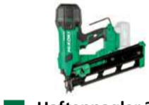
Haftennagler 20° NR1890DRA_HAFTE HK20R - 25-35 mm 939.-