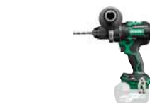
Bohrschrauber DS36DC 155/100 Nm 424.-