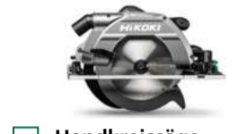
Handkreissäge C3609DUM 85 mm 711.-