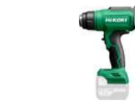
Heissluftpistole RH18DA 30-550° C 211.-