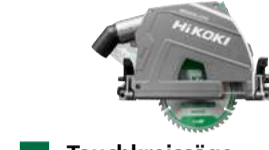
Tauchkreissäge C3606DPA 66 mm - Softstart 699.-