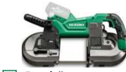
Bandsäge CB3612DA 127 x 120 mm 674.-