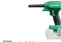
Gebläse RA18DA 122 m/s - 0,4 kg 149.-