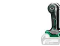
Lampe UB18DJL 230 Lumen 74.-