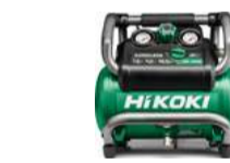
Kompressor EC36DA 7,6 L - 135 psi - 12,4 kg 549.-