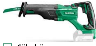
Säbelsäge CR18DBL 32 mm - 2,500 /min. 374.-