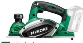
Hobel P18DSL 82x2 mm 349.-