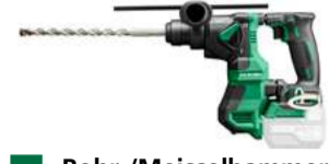
Bohr-/Meisselhammer DH18DPA SDS+ - 18 mm - 1,3 J 399.-