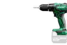
Schlagbohrschrauber DV18DD 55 Nm - 1,3 kg 224.-