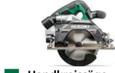
Handkreissäge C3606DB Ø165 mm - 66 mm 486.-