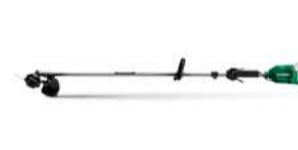
Freischneider CG18DA loop handle 332.-