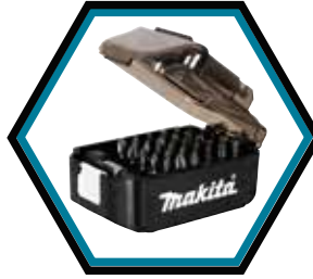
E-00016 - Bitset 31- teilig Akku-Form

Leerlaufdrehzahl : 0 - 500 / 0 - 1'900 U/min Leerlaufschlagzahl : 0 - 7'500 / 28'500 Schläge/min Bohrfutterspannweite : 1,5 - 13 mm Bohrleistung in Holz/Stahl/Mauerwerk : 38/13/13 mm Drehmoment hart/weich : 50/27 Nm Maximale Leistung : 350 W Gewicht mit Akku : 1,8 kg