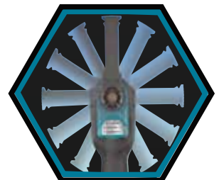
Das Werkzeug kann in 12 Stufen um 360° aufgesteckt werden°.