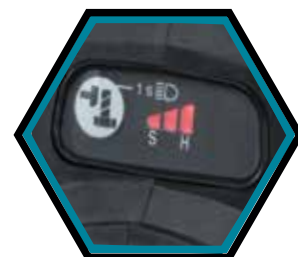
3 verschiedene Drehzahleinstellungen.