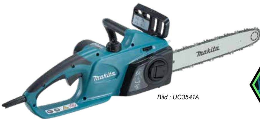
Bild : UC3541A