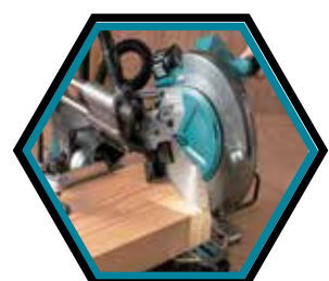
Ein LED-Licht wirft eine Schattenlinie vom Sägeblatt.

Durchmesser Sägeblatt : 260 mm Leerlaufdrehzahl : 3'600 U/min Max. Schnittleistung 90° : 91 x 279 / 68 x 310 mm Schrägschnitt bei 45° L : 58 x 279 / 42 x 310 mm Coupe inclinée 45° D : 43 x 279 / 29 x 305 mm Max. Neigungswinkel R : 48 / 48° Maximale Leistung : 1'600 W Gewicht mit Akku : 25,1 kg