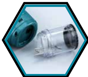
Mit transparentem Stiftauffangbehälter.