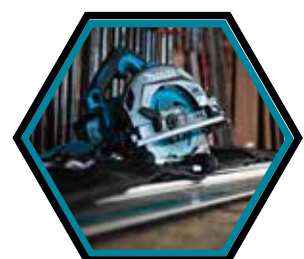
Passet ohne Adapter auf Führungsschiene.

Durchmesser Sägeblatt : 190 mm Leerlaufdrehzahl : 6'000 U/min Max. Schnittleistung 90°/48°/45° : 62,5/41/44,5 mm Maximale Leistung : 1'300 W Gewicht mit Akku : 3,7 kg