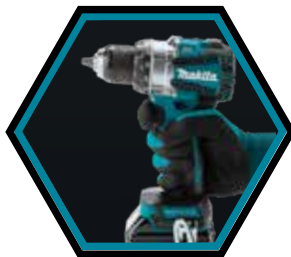
Kompakte und ergonomische Maschine.

Geliefert mit 2x Akkus 5.0 Ah, Schnellladegerät und Makpac-B Transportkoffer