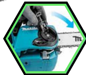
Mit Kettenwechsel und Kette Anziehen ohne Werkzeug.