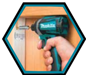
Ideal für die Arbeit an engen Stellen.

Leerlaufdrehzahl : 0 - 1'100 / 2'100 / 3'600 U/min Leerlaufschlagzahl : 0 - 1'100 / 2'600 / 3'800 Schläge/min Aufnahme : 1/4" Drehmoment hart : 175 Nm Gewicht mit Akku : 1,6 kg